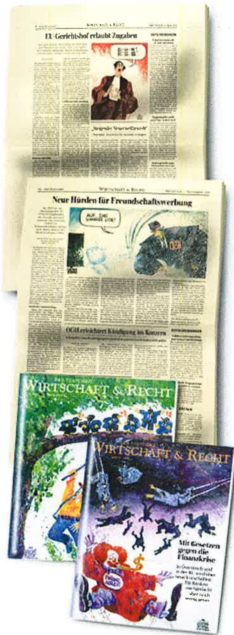
Stand: 25. Oktober 2010 / FSHBL02