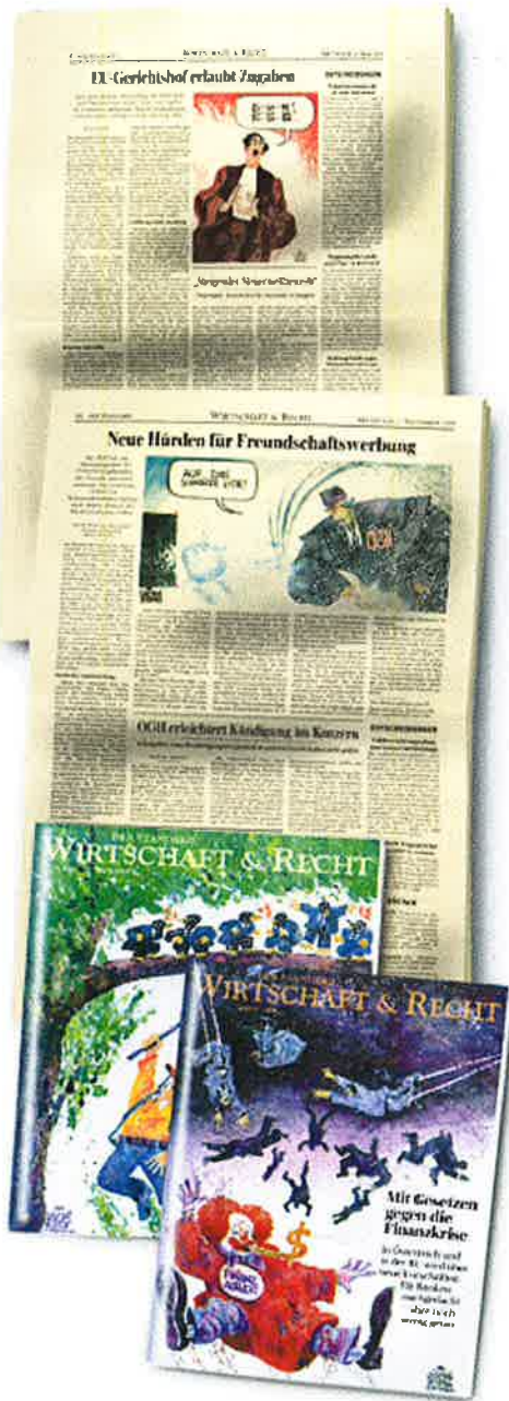
Stand: 25. Oktober 2010 / FSHBL02